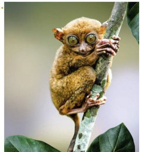
2 Le tarsier des Philippines. C'est l'un des plus petits primates existants. Il mesure environ 10 cm.