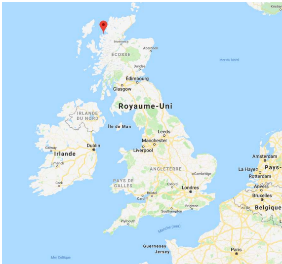
Document de référence Localisation de la baie de Gruinard en Ecosse.

On rappelle que l'isostasie traduit l'état d'équilibre des roches de la lithosphère sur l'asthénosphère. Cet équilibre est responsable de mouvements verticaux de la lithosphère qui ont lieu sur plusieurs dizaines de milliers d'années.