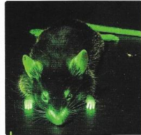
Une souris génétiquement modifiée. La lumière verte est camouflée par les poils.

Une expérience de transgénèse. Après injection du gène GFP d'un chromosome de méduse, le souriceau émet une lueur verte lorsqu'il est placé sous une lampe UV. Seuls le museau et les pattes s'éclairent.