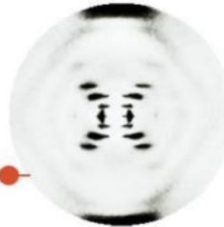
Photographie B51 de l'ADN obtenue par cristallographie aux rayons X.

France, au Laboratoire central des services chimiques de l'État que Rosalind apprend les techniques de cristallographie et notamment la diffractométrie de rayons X qui fera par la suite sa renommée. En effet, de retour à Londres comme chercheuse au King's College, Rosalind Franklin applique la diffraction des rayons X à l'étude de la molécule d'ADN. Elle est ainsi la première à prendre une photographie de la structure de l'ADN cristallisé.