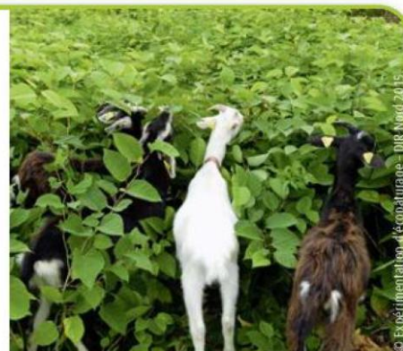
▲ Des chèvres pour lutter contre la propagation de la renouée du Japon.

La renouée du Japon est une plante invasive importée du Japon dans les jardins du monde entier à partir du 19 e siècle. Elle envahit aujourd'hui tous types d'environnement humide. Elle produit dans le sol des substances toxiques pour les autres espèces. Ses rhizomes peuvent aussi totalement occuper le sol, jusqu'à un mètre de profondeur, empêchant la formation des racines d'autres végétaux. Des chercheurs ont étudié l'effet de cette plante sur les autres végétaux.