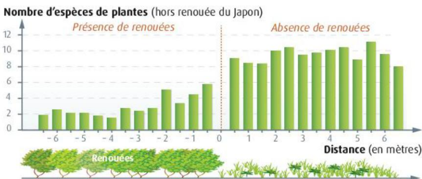
▲ L'effet de la renouée du Japon sur la biodiversité végétale.

QUESTION Décrivez l'effet de la renouée du Japon sur la biodiversité. Votre réponse comprendra des données chiffrées et précisera le niveau de biodiversité étudié.