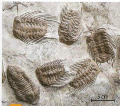
1 Trilobites fossiles

L'ère primaire est une période géologique s'étendant de - 570 à - 245 millions d'années. De nombreux fossiles ont été trouvés dans des roches datées de cette époque. Les scientifiques se sont notamment appuyés sur l'étude des fossiles pour découper les temps géologiques.