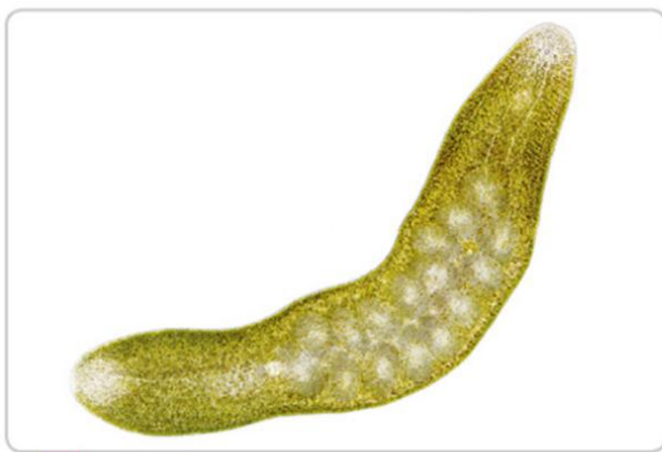
a Observation à la loupe binoculaire du ver de Roscoff.