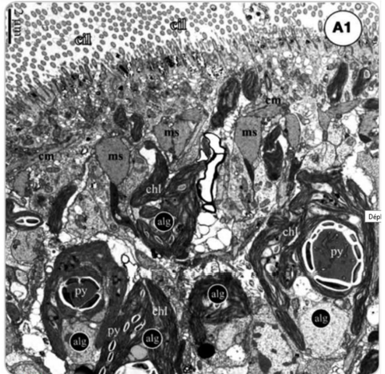
b Observation au microscope électronique à transmission d'une coupe d'un ver de Roscoff adulte. cm et ms : cellules musculaires, alg : algue, chl : chloroplaste, py : pyrénoïde (enzymes de la photosynthèse).